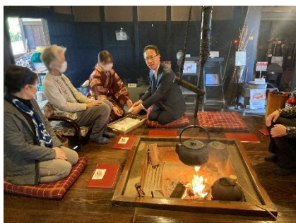
12月2日 川越道緑地 古民家園 お茶会