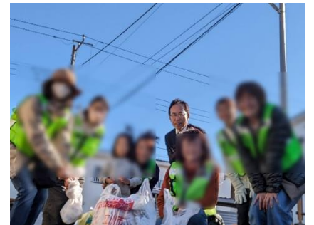
12月17日 青少年健全育成柏町地区委員会 美化清掃活動