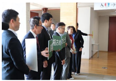
12月12日 東京ヴェルディ J1昇格報告 お出迎え