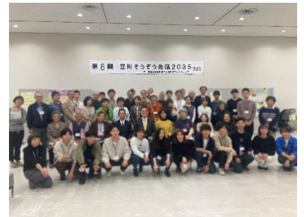
11月23日 立川そうぞう会議 2035 報告会