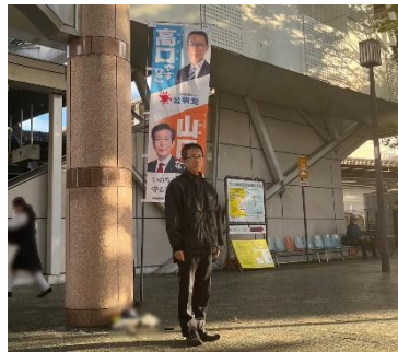
毎週週頭 玉川上水駅南口 個人街頭