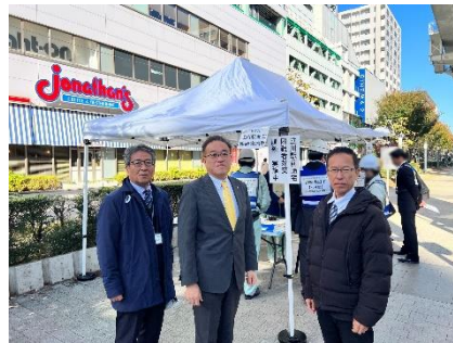
11月27日 立川駅前 帰宅困難者対策訓練