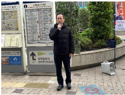
毎月初頭 公明党立川市議団 立川駅街頭