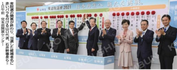
衆議院の開票が終わり、当選した候補者名に赤いバラを付けた出口代表、右から候補者名に1日前、党本部開票センター。