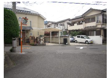
砂川町 7 丁目にカーブミラー

砂川町 7 丁目 13 番の T 字路に”この右行き止まり”の看板が設置されました。この先は車返しもなく、近隣住民の方々から要望を受けていたものです。