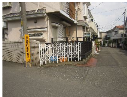
砂川町 7 丁目に看板設置

柏町 2 丁目と砂川町 1 丁目の境の通学路が、このほど補修整備されました。痛みがひどく、近隣住民の方々から要望を受けていたものです。