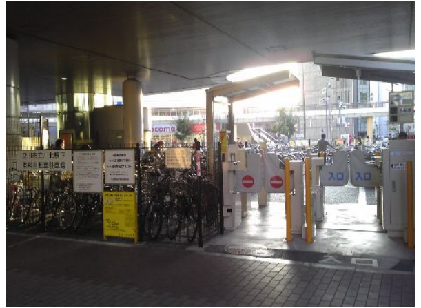
立川北駅下有料自転車駐車場

平成 27 年 4 月 1 日から、市内の自転車等駐車場料金が新しくなる予定です。駐車後 3 時間は無料とし、その後 2 時間は 50 円になります。その後は、概ね駅からの距離によって課金され 4 時間毎 100 円、入庫から 24 時間毎 130 円等といった料金体系になります。買物などの比較的短い時間の駐車需要にも対応するための短時間無料サービスを導入し、放置自転車対策を進めます。