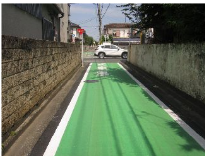
柏町 2 丁目の通学路補修

柏町 2 丁目と砂川町 1 丁目の境の通学路が、このほど補修整備されました。痛みがひどく、近隣住民の方々から要望を受けていたものです。