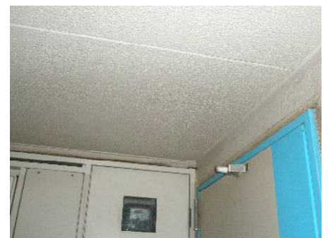
大山団地の通路の天井を整備

泉市民体育館に隣接する公園のベンチが、このほど新しく改修されました。この公園は、高齢者の方も多く利用されています。その利用者の方から要望を受けていたものです。