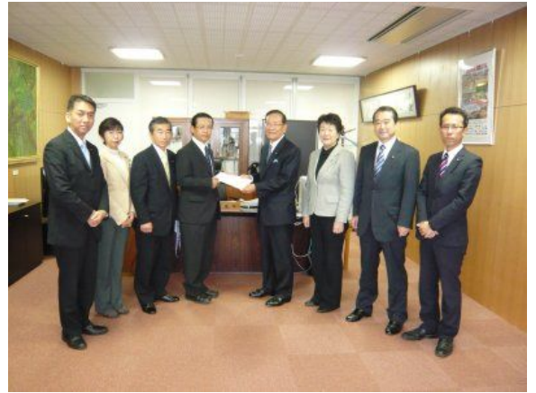
市長に予算要望書を提出