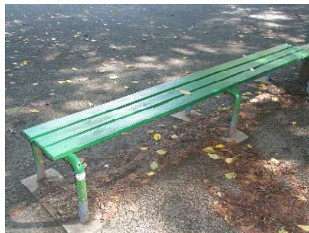
公園のベンチの改修

芋窪街道付近の、柏町 3 丁目の道路の傷みがひどく、長年未整備の状態が続いていました。私は、市道路課に申し入れましたが、このほど整備されました。