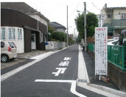
柏町 3 丁目付近の道路整備

芋窪街道付近の、柏町 3 丁目の道路の傷みがひどく、長年未整備の状態が続いていました。私は、市道路課に申し入れましたが、このほど整備されました。