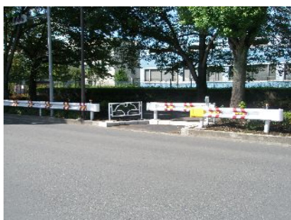
市役所交差点に原付バイクの一時待機スペース設置