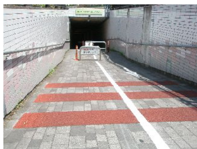
玉川上水駅下の歩道の整備

玉川上水駅下を走る都道の脇の歩道に、自転車に注意を促すカラー塗装が敷設されました。ここを通行する歩行者・自転車の利用者から要望を受けていたものです。(左の写真)