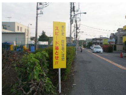
「スピード落とせ」の看板設置

大山団地東交差点から大山団地へ向かう途中の都道に「スピード落とせ」の看板が設置されました。今後、ここの歩道整備に向けて頑張って参ります(左の写真)