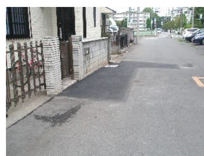
柏町 4丁目付近の雨水浸透整備

大山団地東交差点から大山団地へ向かう途中の都道に「スピード落とせ」の看板が設置されました。今後、ここの歩道整備に向けて頑張って参ります(左の写真)