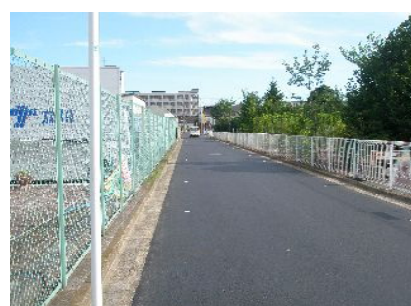
柏町 1丁目付近の車道整備

玉川上水駅下を走る都道の脇の歩道に、自転車に注意を促すカラー塗装が敷設されました。ここを通行する歩行者・自転車の利用者から要望を受けていたものです。(左の写真)