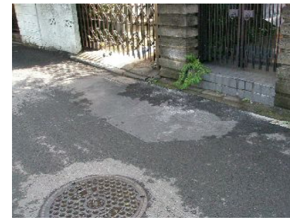
砂川町 7丁目の雨水浸透整備