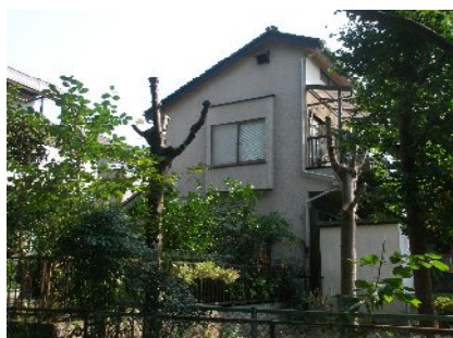
柏 4北公園の樹木を剪定