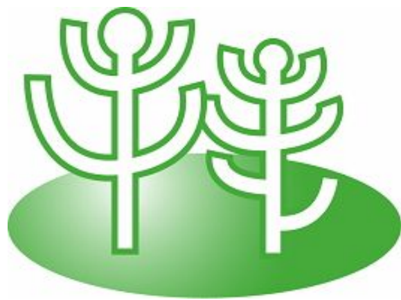
市民交流大学のシンボルマーク

※講座申込など問い合わせは、市のホームページのほか、立川市教育委員会・教育部生涯学習推進センター（電話527-5757）