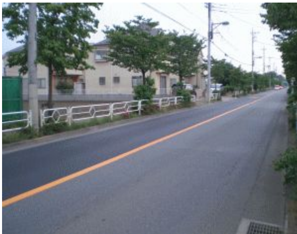
平成新道の道路補修

平成新道柏町4丁目（日大二高グラウンド付近）は、道路の傷み方が激しくなっていました。住民の方々から、「道路の補修工事を」との要望を受け、市当局に早期補修を要請していましたが、このたび、道路の補修工事が完了しました。