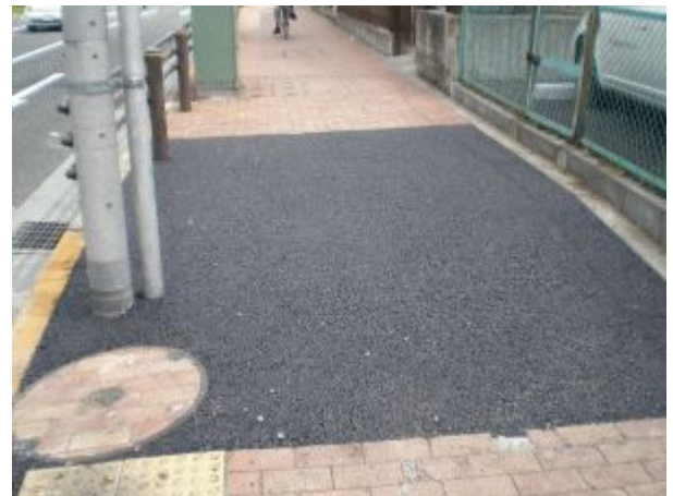
こぶし会館付近の歩道整備

平成新道柏町4丁目（日大二高グラウンド付近）は、道路の傷み方が激しくなっていました。住民の方々から、「道路の補修工事を」との要望を受け、市当局に早期補修を要請していましたが、このたび、道路の補修工事が完了しました。