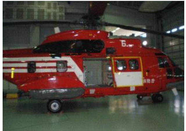
格納庫内の東京型ドクターヘリ

視察を終え、先の参院選で公明党が公約した「ドクターヘリの全国配備」を、一刻も早く実現しなければならないと痛感しました。