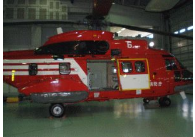
格納庫内の東京型ドクターヘリ

視察を終え、先の参院選で公明党が公約した「ドクターヘリの全国配備」を、一刻も早く実現しなければならないと痛感しました。